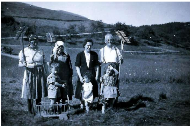
Fotounterzeilen: Heuernte 1942 in Obersteinebach.