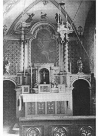
Der alte Hochaltar

Die „Alte Kirche“ war den Peterslehrern (Zitat von 1820) „alt, schlecht und unreinlich“ und außerdem zu klein geworden. 1897 schlug der Blitz in den Turm ein, so half die Natur das Bauvorhaben zu beschleunigen. Nach den Entwürfen des Architekten Ludwig Hofmann aus Herborn wurde ein geräumiges Barockschiff nördlich an den alten Chor und das romanische Schiff angebaut. Dazu wurde die alte Kirche (bis auf den Turm) niedergelegt und neu aufgebaut. Seit wann genau St. Petrus in Peterslahr verehrt wird, ist nicht gewiss. Bei der Stiftung des Altenberger Gutes an die Pfarrei im Jahr 1469 ist bereits von einem Petrusaltar die Rede.