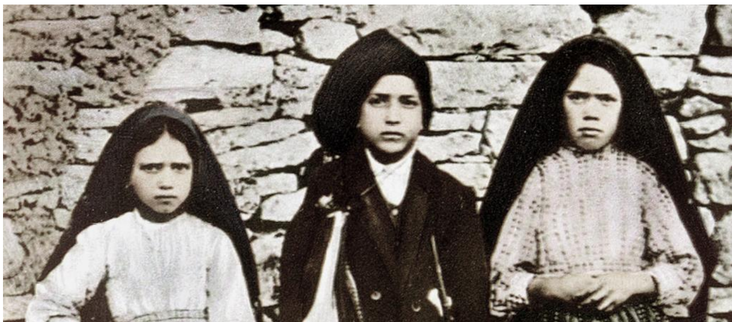
links die neuen Heiligen Jacinta und Francisco Marto, rechts Lucia dos Santos